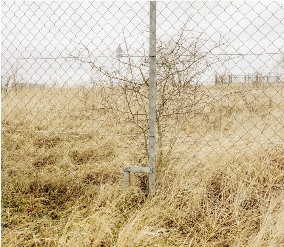
Image : Marina Caneve, Escape-device , Copenhagen, Denmark, 2024. Issu du projet On the ground among the animals Le projet a été rendu possible grâce au soutien de l'Italian Council (2023)

→ Samedi 14 décembre de 15h à 20h ouverture de l'exposition, en présence de l'artiste