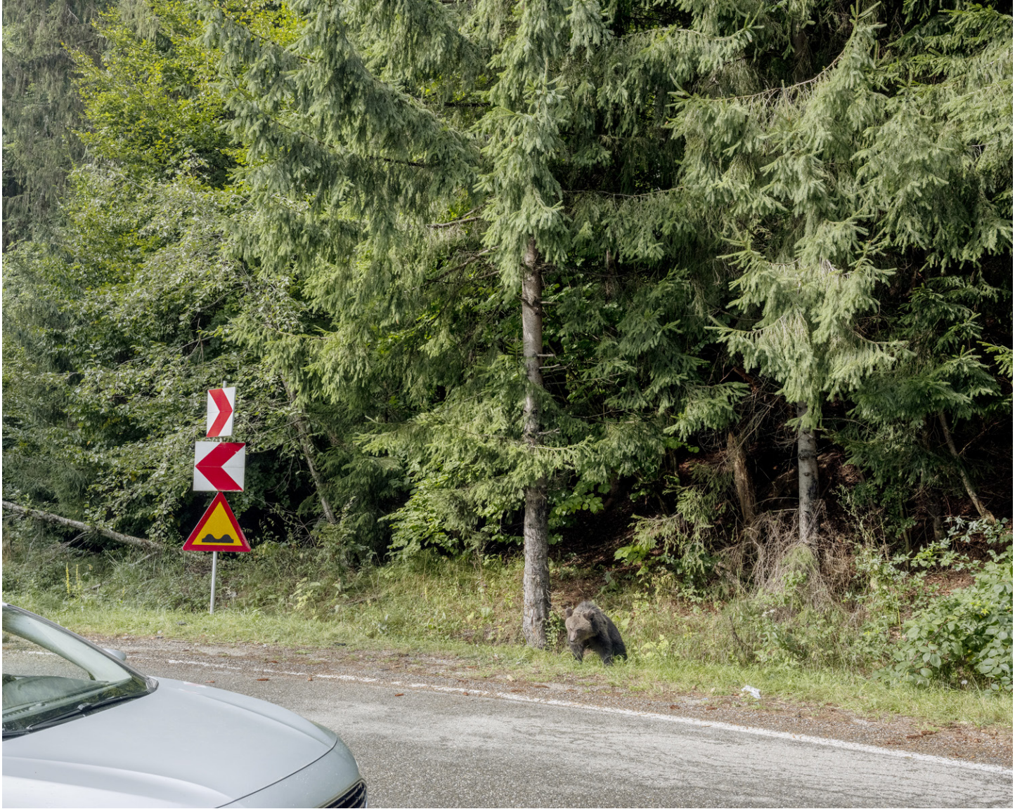
Marina Caneve, Transfăgărășan, Arefu, Romania , impression sur papier coton, couleur, cadre en bois, 100×125cm, 2024. Issu du projet On the ground among the animals . Le projet a été rendu possible grâce au soutien de l'Italian Council (2023).