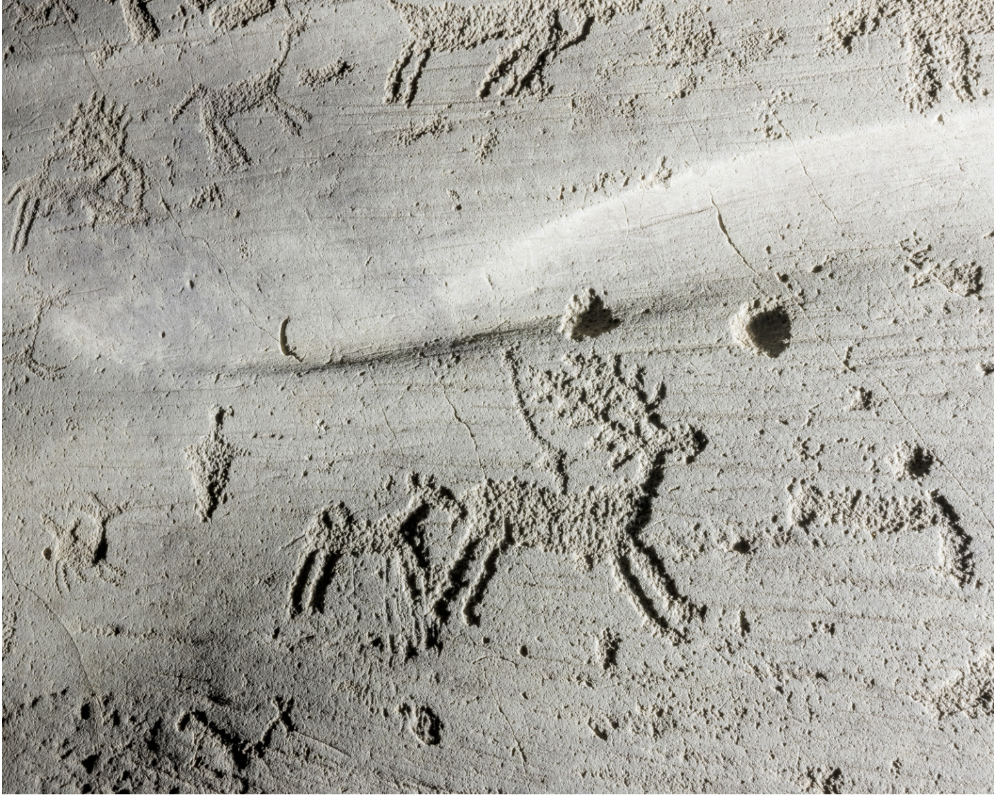
Marina Caneve, Roccia 1 , Parco Nazionale delle Incisioni Rupestri, località Naquane, Capo di Ponte, impression sur papier coton, couleur, cadre en bois, 100×125cm, 2024.

Issu du projet On the ground among the animals . Le projet a été rendu possible grâce au soutien de l'Italian Council (2023).