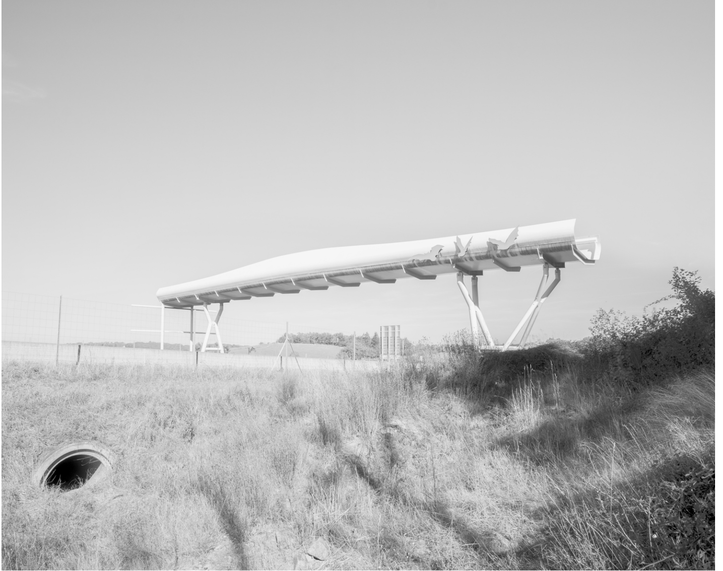
Marina Caneve, issue de la série On the ground among the animals , 2023.

Issu du projet On the ground among the animals . Le projet a été rendu possible grâce au soutien de l'Italian Council (2023).