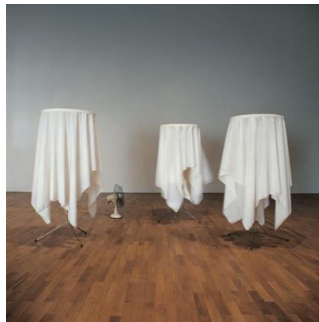
Marius BOEZEM Wind Tables , 1968 119 x 50 cm de diamètre Collection MacLyon © Marinus Boezem

Photographie noir et blanc tirée sur film transparent, cheveux, vêtements et bijoux collés sur plexiglas, 143x80x3 cm et chaise en bois Centre d'art contemporain Vénissieux © Blaise Adilon