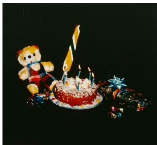
Christian BOLTANSKI L'Ours jaune , série Les Compositions photographiques Ancien titre : Gâteau d'anniversaire, 1977 Tirage unique couleur monté sur aggloméré, 100 x 100 cm Collection IAC Villeurbanne © Adagp, Paris