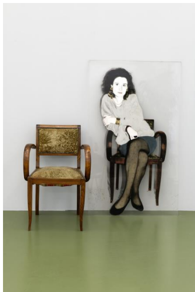
Danielle CASSENX Sophie , 1993

Photographie noir et blanc tirée sur film transparent, cheveux, vêtements et bijoux collés sur plexiglas, 143x80x3 cm et chaise en bois Centre d'art contemporain Vénissieux