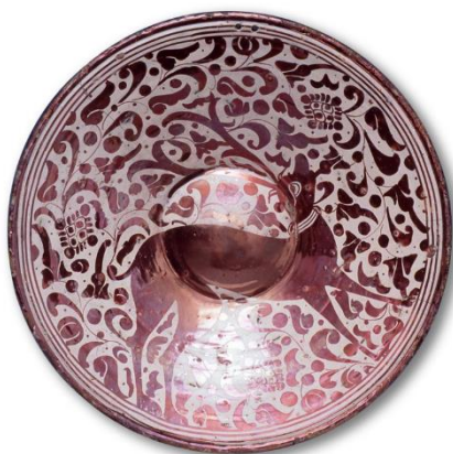
Plat à marli à motif de cerf, Faïence hispano-mauresque Début du XVIIe siècle, Reus Diamètres : 37,7 et 12,5 cm ; Profondeur : 6,8 cm Collection Musée des Beaux-Arts Lyon

Un courant d'air diffusé par un ventilateur à tête mobile agite alternativement les draps couvrant trois minces guéridons. L'ensemble évoque une possible présence.