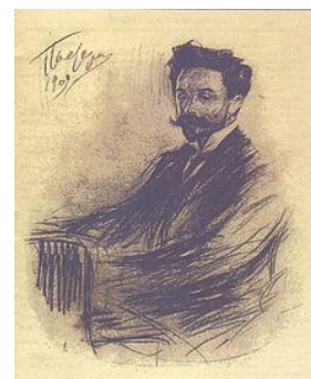
1Scriabine au piano par Leonid Pasternak.

Ses pièces, presque toutes pour piano, évoluent progressivement d'un style proche de Chopin, Liszt et Wagner (post-romantisme) à une esthétique individuelle (atonal libre – non-sériel) visant un art synthétique.