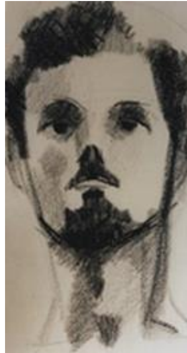
ERRÓ (Gudmundur GUDMUNDSSON, dit) Portrait , vers 1950 Collection MAC LYON © Adagp, Paris