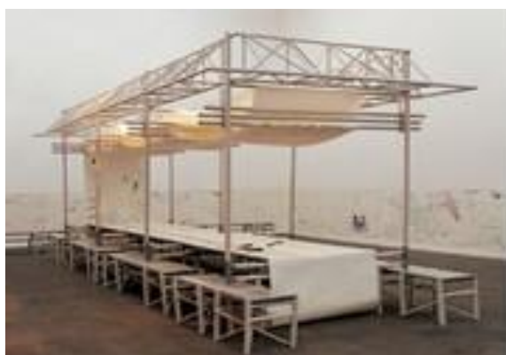
Niek van de STEEG Structure de correction, table de débat , vers 2000 Dépôt au MAC LYON

Deux mains manipulent un morceau de papier d'aluminium qui prend toutes sortes de formes en parfaite symétrie.