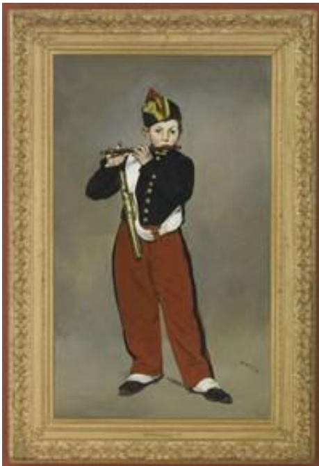
Edouard MANET Le joueur de fifre , 1866