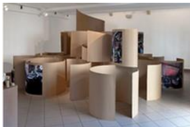
Yona FRIEDMAN Sans titre, 2012 Collection MAC LYON © Adagp, Paris Photo : Blaise Adilon

Autour de cette table on peut s'asseoir, écrire sur la nappe de papier qui la recouvre et qui s'enroule sur elle-même pour former un faux plafond.