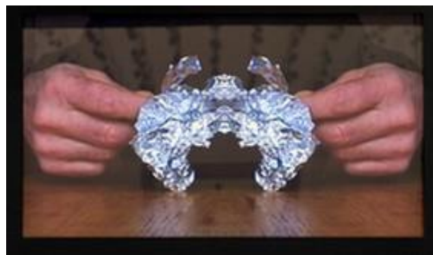
Michel FRANÇOIS Déjà vu (Hallu) , 2003, vidéo Dépôt à l'IAC Villeurbanne © Adagp, Paris

Photographies couleur de façades d'immeubles imprimées sur papier satiné, pliées et assemblées sur une table de présentation.