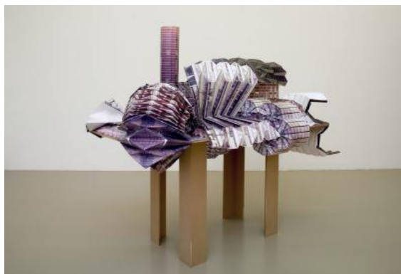
Louis THEILLIER Réhabilitation , 2005 Collection IAC Villeurbanne © droits réservés Crédit photographique : André Morin

Photographies couleur de façades d'immeubles imprimées sur papier satiné, pliées et assemblées sur une table de présentation.