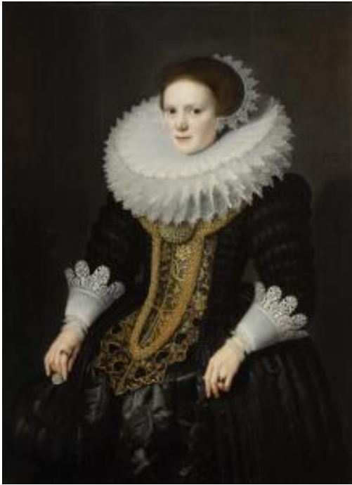
Michiel Jansz VAN MIEREVEL Portrait de femme , 1625.