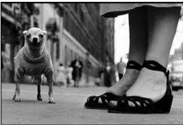
Photographie d'Elliott Erwitt, rétrospective à la Sucrière de Lyon du 21/10/2023 au 17/03/2024 (en lien avec le cadrage à hauteur des grenouilles et des chaussures de la camarade de classe d'Elliot)