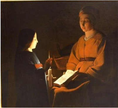
L'éducation à la vierge de Georges de la Tour 17 ème (en lien le clair-obscur, l'utilisation de lumière)