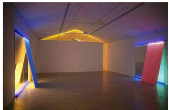
KEITH SONNIER Mirror Act II , 1970 Miroirs, lumière noire, gouache fluorescente, styroform, glissières aluminium 213 x 213 cm, 50 m 2 Collection MacLYON © Adagp, Paris