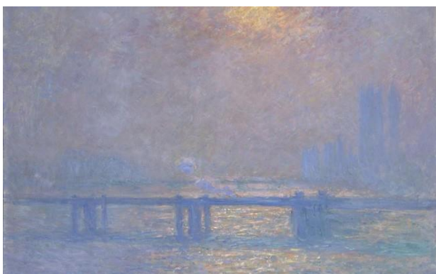
CLAUDE MONET Charing Cross Bridge, la Tamise , 1903 Huile sur toile H. 73,4 ; L. 100,3 cm