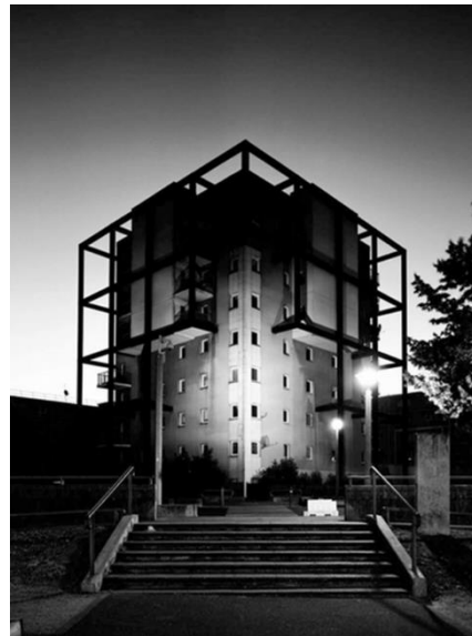
KARIM KAL « La tour », 2011 Tirage jet d'encre contrecollé sur dibond Espace d'arts plastiques Madeleine Lambert / Centre d'art contemporain Vénissieux © Blaise Adilon