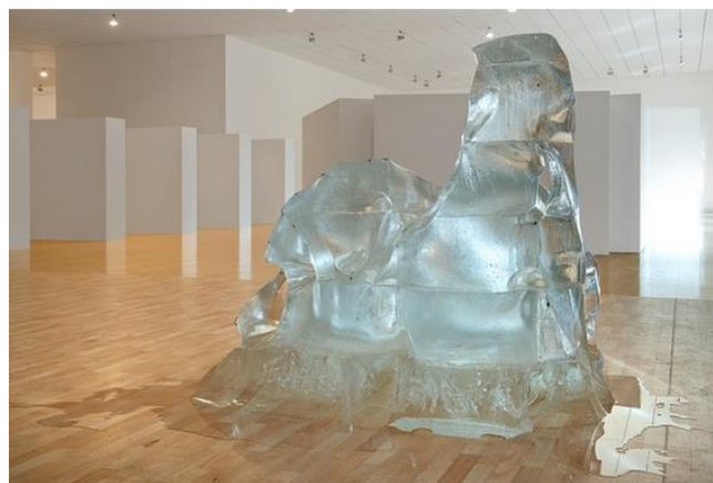
Olivier MOSSET Toblerone, 2005 Sculpture : polyèdre composé de pains de glace. 180 x 220 x 180 cm Le Toblerone est le surnom de barrages antichars, construits entre 1939 et 1945 sur tout le territoire suisse. Collection MAC Lyon © Adagp, Paris