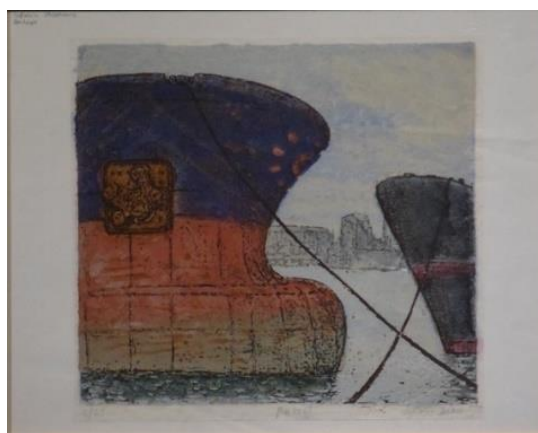
Sylvain SALOMOVITZ, « Penhoët – 1993 » Gravure sur bois tirage 4/25 (34,8 x 37,5) acquisition 2006. Artothèque de Saint-Priest