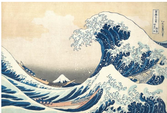
Katsushika HOKUSAI La Grande Vague de Kanagawa, 1830