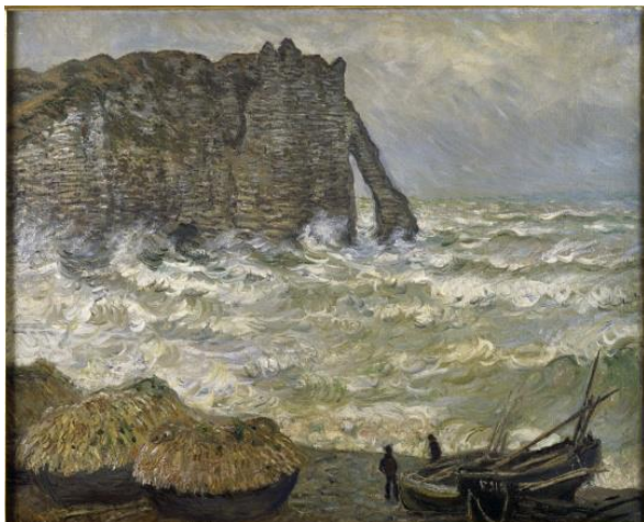
Claude MONET Mer agitée à Etretat, 1883 Collection Musée des Beaux Arts Lyon