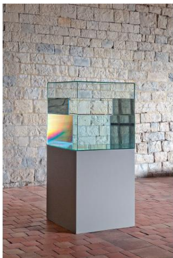
Ann Veronica JANSSENS Cocktail sculpture – 2008 Verre, huile de paraffine et eau distillée IAC Villeurbanne © Adagp, Paris Photo : Blaise Adilon