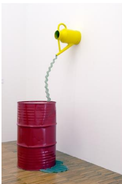
Etienne BOSSUT La source, 1983 L'oeuvre est composée de 4 éléments moulés en résine représentant un arrosoir au mur qui "déverse" un filet d'eau fictif dans un bidon au sol. Une flaque d'eau, représentée par un moulage de plaque ondulée verte translucide, est placée au pied de ce bidon. Métal, résine polyester teintée dans la masse, peintures rouge et jaune Collection IAC Villeurbanne © Etienne Bossut