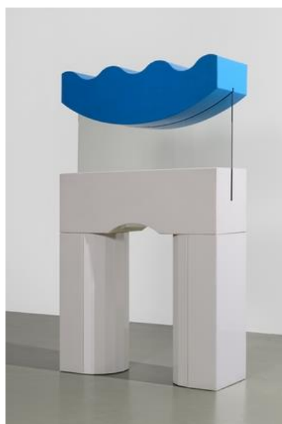
Michel VENTRONE « ... et des envies de Méditerranée », 1989, acier, peinture époxy et verre, 90 x 30 x 152 cm, Don Pascale Triol Collection Ville de Vénissieux / Espace d'arts plastiques Madeleine Lambert