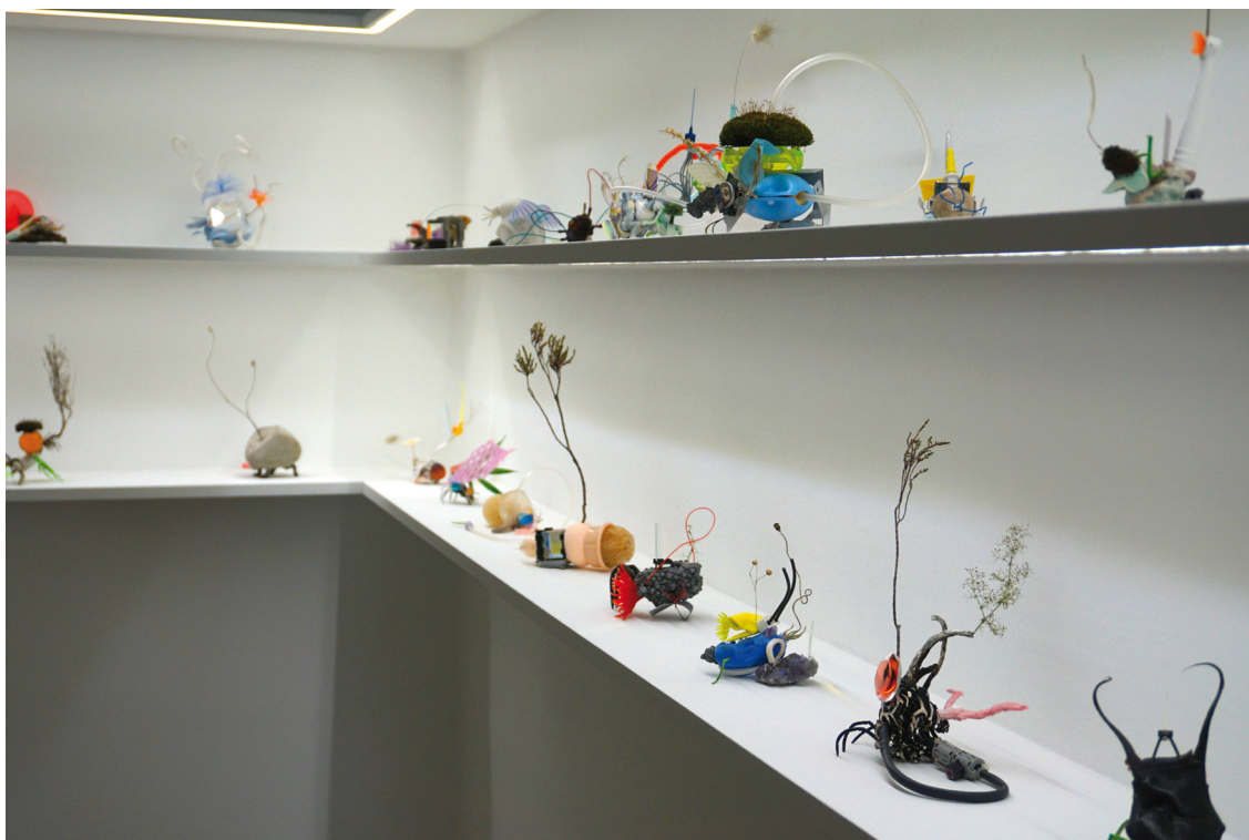
Anthropic Combinations of Entropic Elements , 2017-2019, techniques mixtes