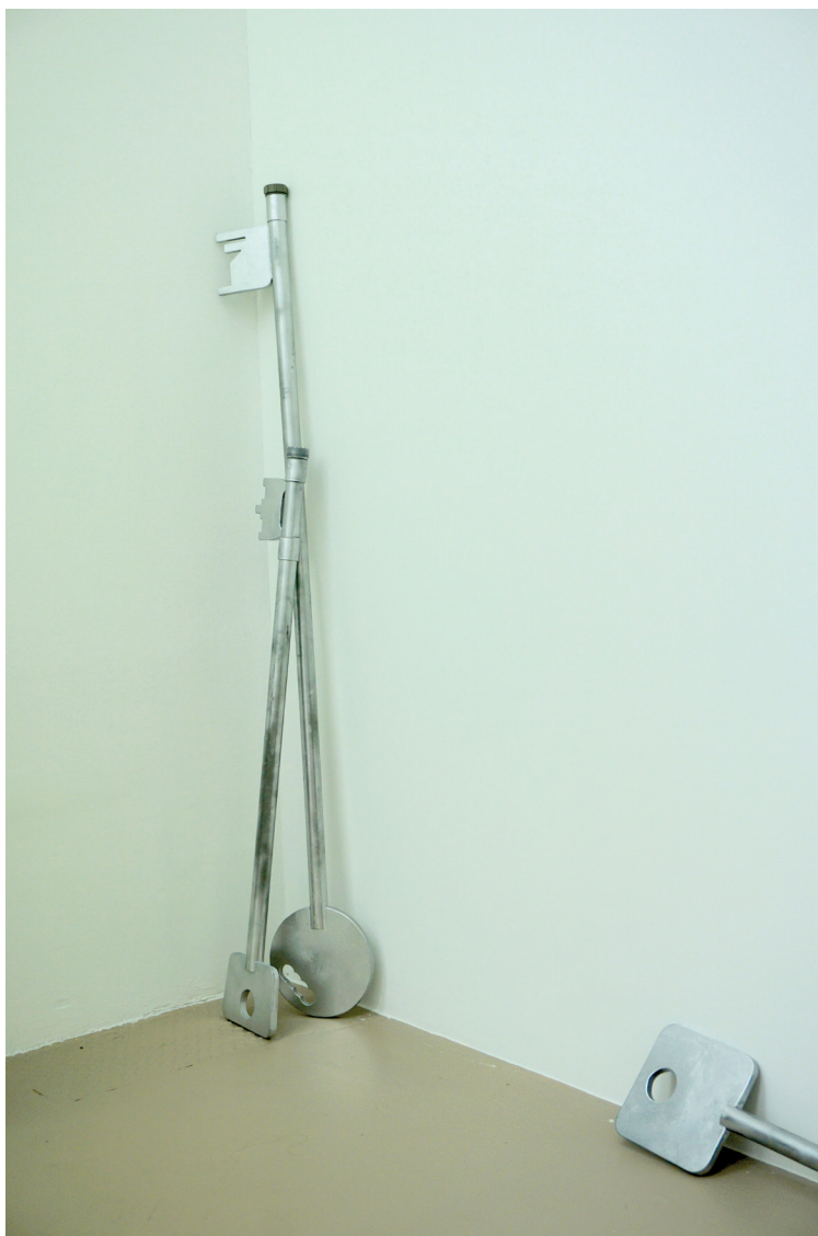
Buried Earth Motors, 2018