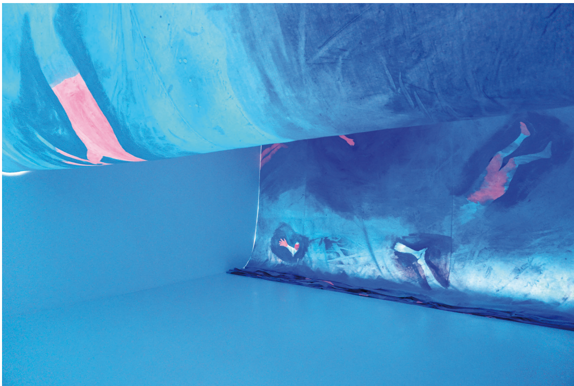
Rosées bleues , 2019