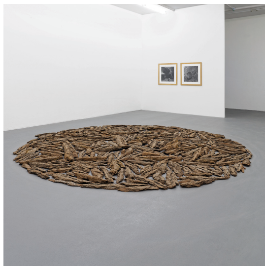
Richard Long, Pine Tree Bark Circle , 1985

Richard Long est né en 1945 à Bristol où il vit et travaille.