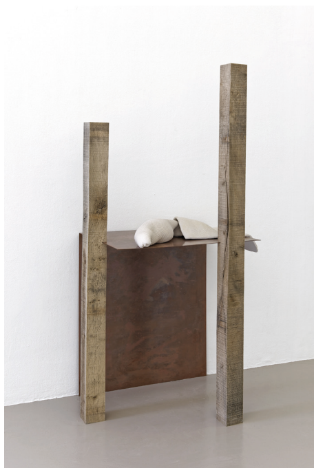
Katinka Bock, Warten, Stehend , 2018

Les visiteurs découvrent plusieurs œuvres dans cet espace. Selon l'âge des élèves il sera intéressant de les regarder dans leur ensemble. Ils pourront voir également en haut du mur, le prolongement de la tuyauterie de l'œuvre précédente Warm sculpture (relaxed) . Vous pourrez vous arrêter ensuite sur Warten, Stehend , 2018.