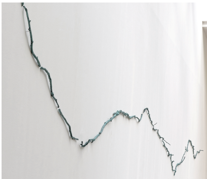
Katinka Bock, Linien und Geraden , 2014

Cette œuvre qui s'étend sur la surface du mur est constituée de fines brindilles moulées en bronze. Comme autant de segments placés les uns à la suite des autres, ils décrivent une ligne courbe et aérienne.