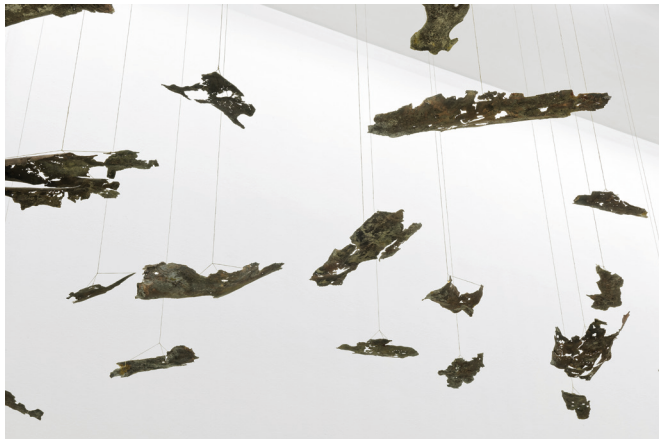
Katinka Bock, Les affres , 2018

Cette installation se compose de fins et délicats mou- lages en bronze d'écorce de platane. Chaque élément est suspendu.