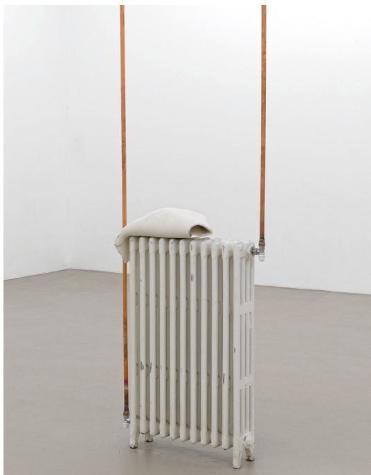
Katinka Bock, Warm sculpture (relaxed) , 2017

L'œuvre se compose d'un radiateur domestique issu d'un appartement d'un immeuble des Gratte-Ciel de Villeurbanne. Situé au centre de la salle, il est raccordé au système de chauffage et la tuyauterie qui lui est reliée traverse tant les espaces d'exposition que les espaces de bureaux situés à l'étage. Une forme en céramique repose sur le radiateur.