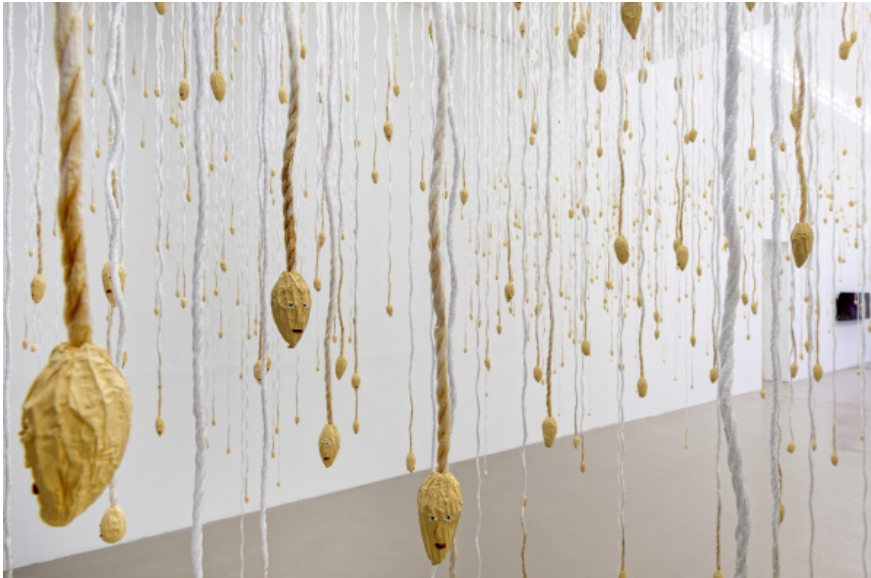
Face on Rope, 2010