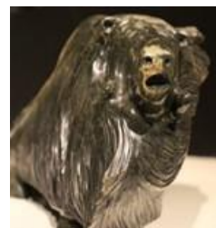
le bœuf musqué