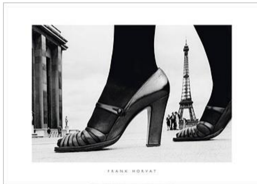
Chaussures et Tour Eiffel Photo noir & blanc Frank HORVAT